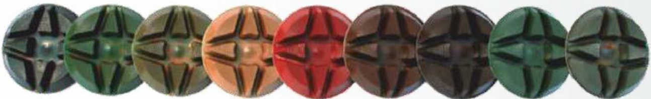
Verfügbare Grits „3 Zoll“, 12mm dick: 30, 50, 100, 200, 400, 600, 800, 1500, 3000 Verfügbare Grits „4 Zoll“, 11mm dick: 50, 100, 200, 400, 600, 800, 1500, 3000