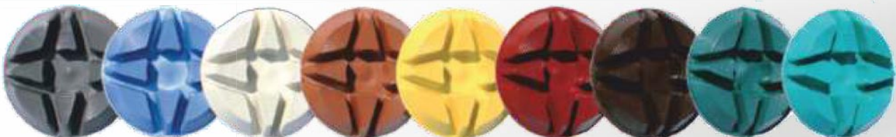
Verfügbare Grits „3 Zoll“, 12mm dick: 30, 50, 120, 220, 400, 600, 800, 1800, 3500, 8500 Verfügbare Grits „4 Zoll“, 11mm dick: 50, 100, 200, 400, 600, 800, 1500, 3000