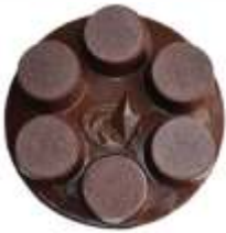
CALIBRA Ceramic Pads Verfügbare Grits: 30, 50, 100, 200

CALIBRA Ceramic Schleifscheiben wurden speziell für das Entfernen von schwierigen Kratzern entwickelt. Sie entfernen Kratzer, welche durch Schleifgänge mit hybriden Schleifwerkzeugen verursacht wurden. Sie sind auch für Bodenrenovierungen bestens geeignet und können in trockenen und nassen Schleifprozessen verwendet werden. Der Einsatz ist vor allem für harte und mittelharte Betonböden vorgesehen. Bei weicheren Betonböden ist die Lebensdauer von CALIBRA Schleifscheiben entsprechend kürzer.