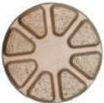
SA SUPERTHICK - Metallschleifscheiben Verfügbare Grits für Terrazzoscheibe „3 & 4 Zoll“: 30 Verfügbare Grits für Kupferscheibe „3 & 4 Zoll“: 120 Verfügbare Grits für Metallscheibe „3 Zoll“: 46, 70, 120, 220, 400 Verfügbare Grits für Metallscheibe „4 Zoll“: 46, 70, 120

SA SUPERTHICK – Metallschleifscheiben bestens geeignet für das Schleifen von Beton, Stein, selbstnivelierte Böden und Terrazzo. Verfügbar in zwei Größen. Befestigung mit Velcro oder mit dem Schnellverschluss-System QUICKCHANGE. Kann für nasse und trockene Schleifprozesse verwendet werden.